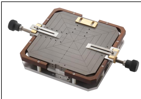
Vakuumaufnahme 6x6" mit mechanischer Klemmung