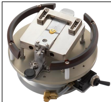
TO Aufnahme mit mechanischer Klemmung